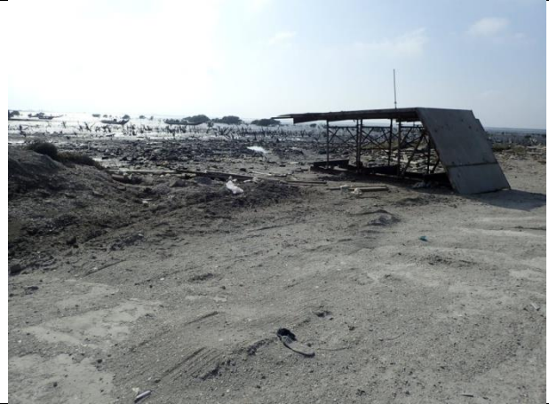
計畫範圍外之潮間帶灘地現況—原本堆置的建築廢棄物及蚵殼已被清除