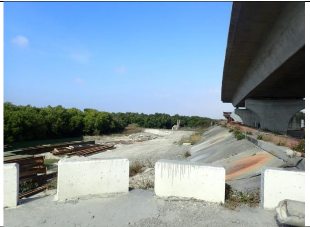
計畫範圍邊緣環境現況