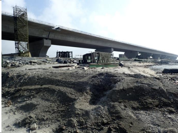
計畫範圍外之潮間帶灘地現況—堆放有西濱工程的沙石及施工機具