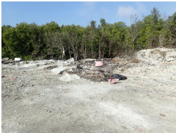
計畫範圍邊緣環境現況—仍有垃圾廢棄物