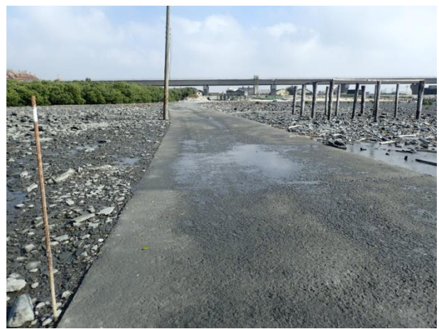
海牛行走路線設施環境現況