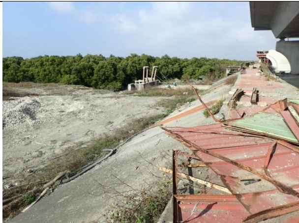
計畫範圍內的紅樹林及堤防邊坡現況