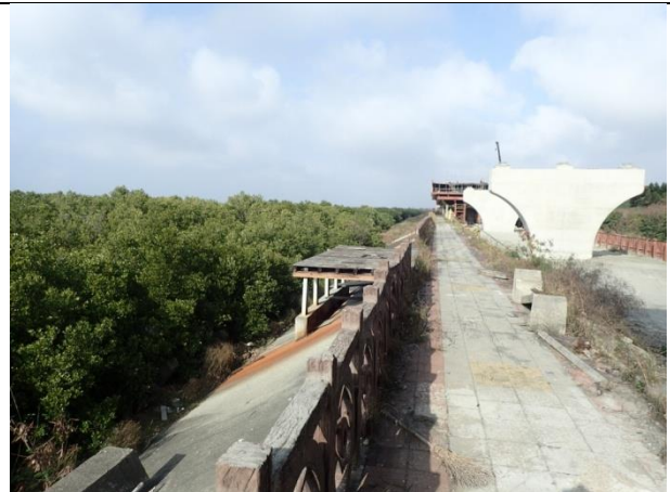
計畫範圍內的堤防設施及西濱道路施工現況