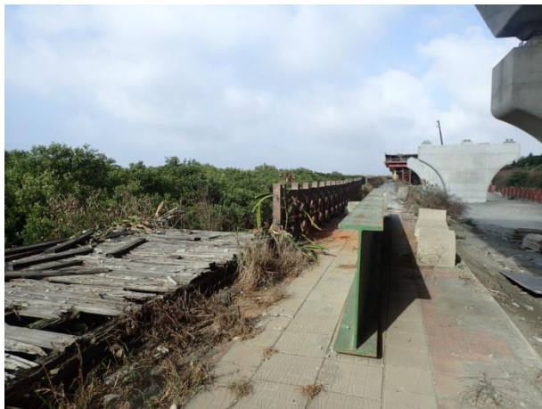
計畫範圍內的堤防設施及西濱道路施工現況