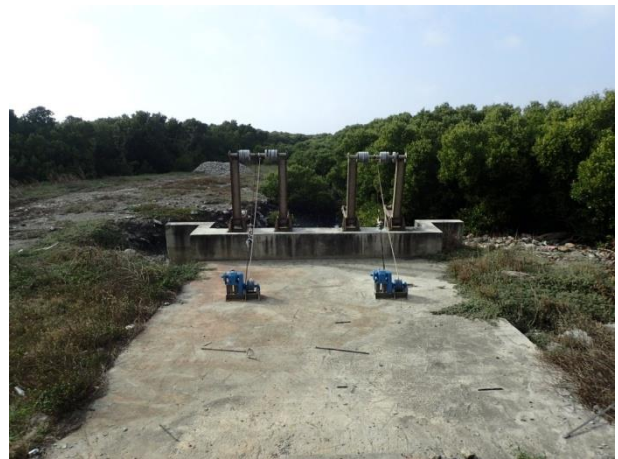
計畫範圍內的水閘門設施及紅樹林現況