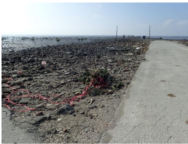
海牛行走路線設施及蚵殼地景區塊環境現況