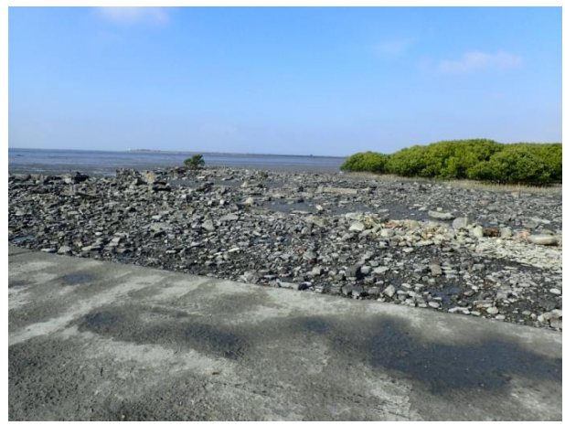
計畫範圍內的紅樹林及泥灘地環境