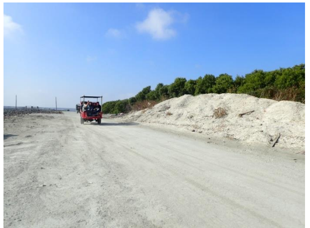
計畫範圍邊緣環境現況—仍有蚵殼堆置