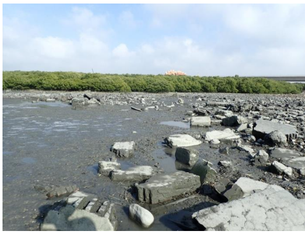
計畫範圍內的紅樹林及泥灘地環境