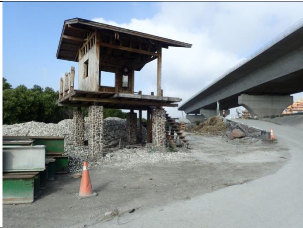
計畫範圍邊緣環境現況